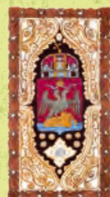
REKA, mestni grb