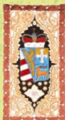
AVSTRIJSKO PRIMORJE (GORIŠKO – GRADIŠKA, ISTR)