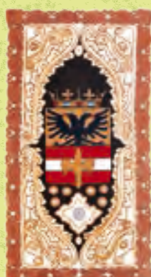
TRST, mestni grb